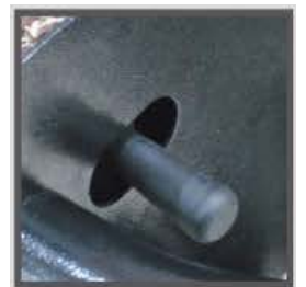
Manija de control