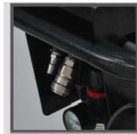
Puerto de suministro de aire