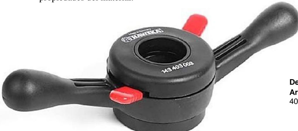
Descripción: ProGrip Artículo: 143 403 003 40X3MM