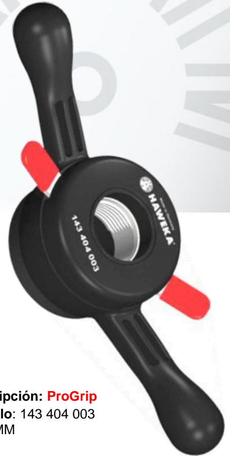
Descripción: ProGrip Artículo: 143 404 003 40X4MM

El ProGrip es una tuerca de sujeción rápida y resistente, es indispensable en la tecnología moderna de Balanceo. Es por esta razón que se creó un nuevo y atractivo diseño funcional para complementar las ya conocidas propiedades del material.